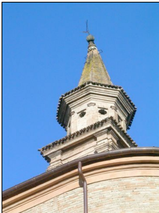
Foto n. 14 – Quattro Castella: chiesa, parziale distacco e pericolo di crollo della parte sommitale della torre campanaria