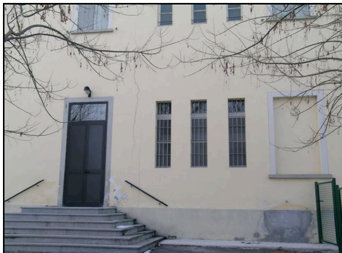
Foto n. 24 – Torrechiara (Langhirano): scuola materna, lesione passante nella parete est (edificio parzialmente inagibile)