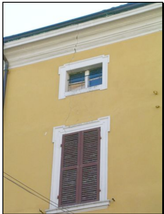
Foto n. 7 – Langhirano: esempio di lesione passante in edificio in muratura