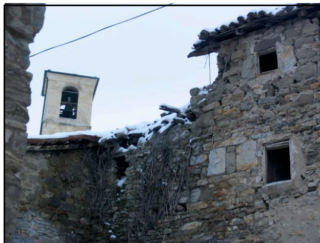
Foto n. 11 - Paderna Chiesa (Vezzano sul C.): crollo parziale in edificio rurale fatiscente