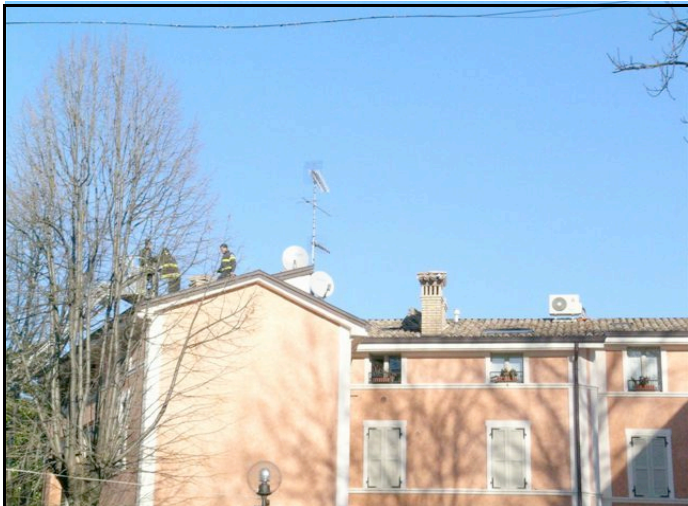
Foto n. 6 – Langhirano: camini danneggiati e pericolanti rimossi dai VVFF