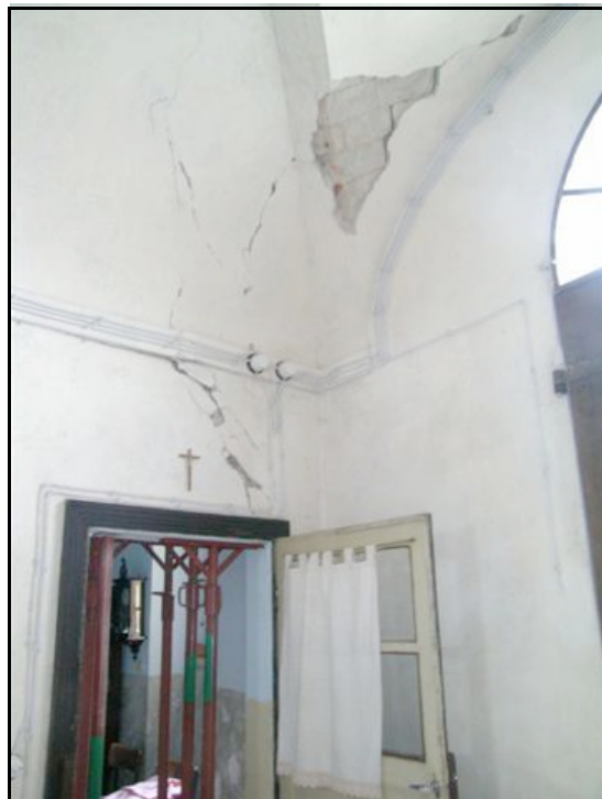
Foto n. 22 – San Michele de' Gatti (Felino): lesioni interne a Villa Ceci