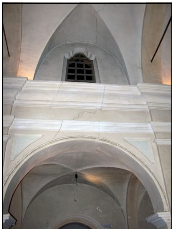
Foto n. 4 – Leguigno (Casina): lesioni diffuse all'interno della chiesa