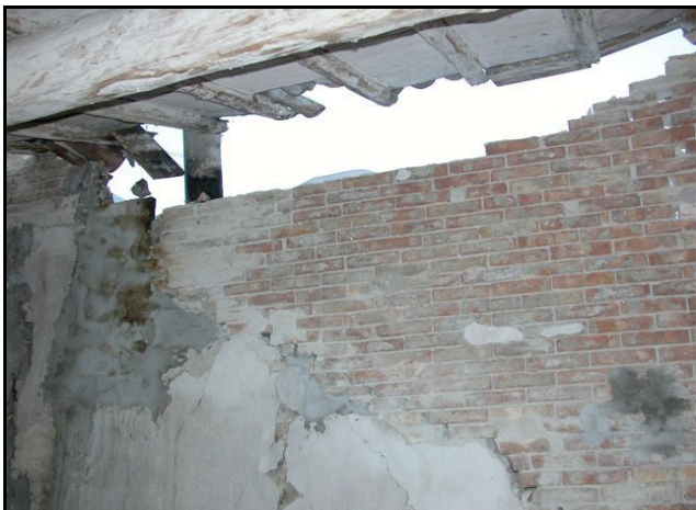
Foto n. 1 – Barbiano (Felino): crollo parziale in un edificio rurale in precarie condizioni