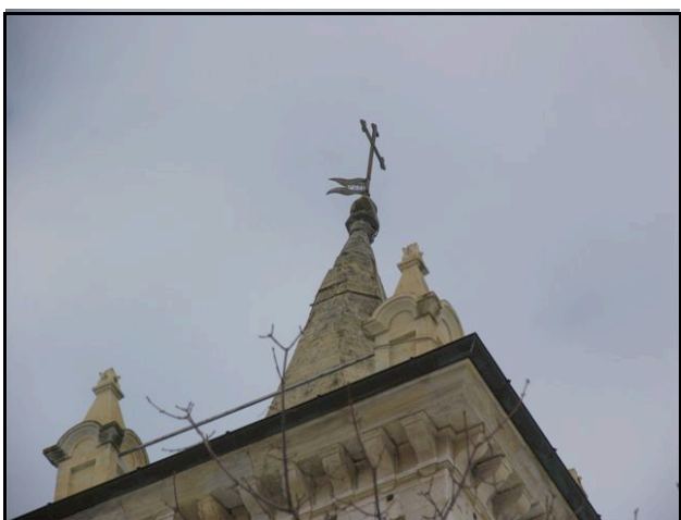
Foto n. 25 – Vezzano (Neviano degli Arduini): chiesa, rottura della parte sommitale della torre campanaria