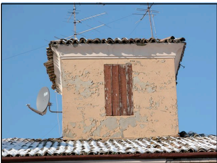
Foto n. 15 – Sala Baganza: scivolamento di tegole e lesioni a una torretta