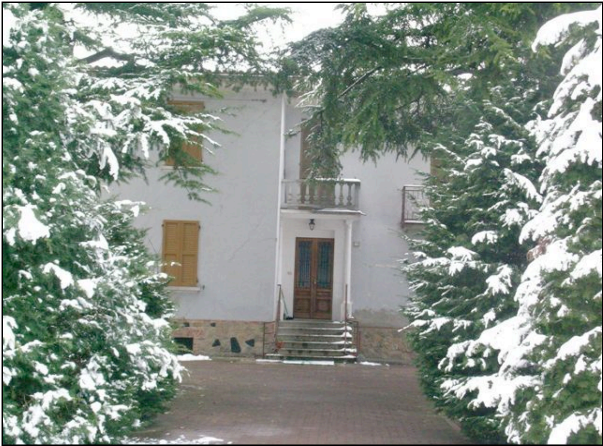
Foto n. 12 – Poggio S. Ilario (Felino): lesioni a X sulla facciata di un'abitazione in muratura