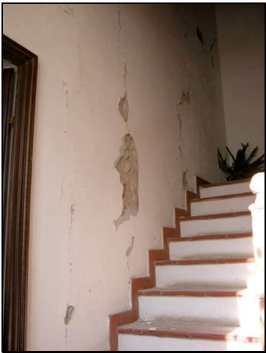
Foto n. 19 – San Vitale di B. (Sala Baganza): edificio privato, lesioni diffuse e distacco di intonaco