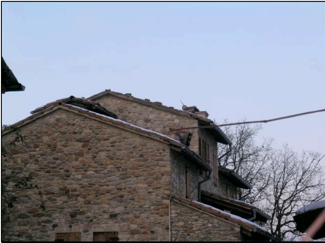
Foto n. 5 – Castello di Torrechiara (Langhirano): caduta di camini in un edificio del borgo