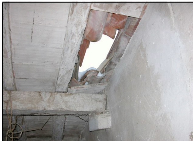
Foto n. 2 – Barbiano (Felino): crollo parziale in un edificio rurale in precarie condizioni