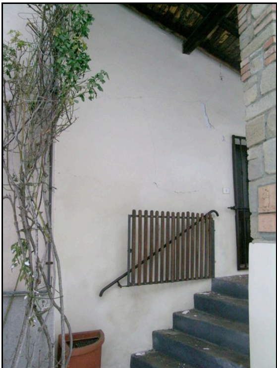
Foto n. 23 – Terenzo: lesioni in edificio in muratura nel centro del paese