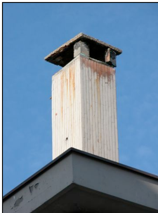
Foto n. 16 – Sala Baganza: caduta e spostamento di pietre in un camino