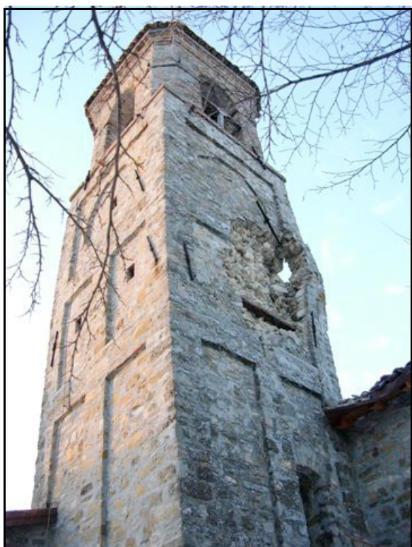
Foto n. 3 – Barbiano (Felino): danni alla torre campanaria, con crollo parziale