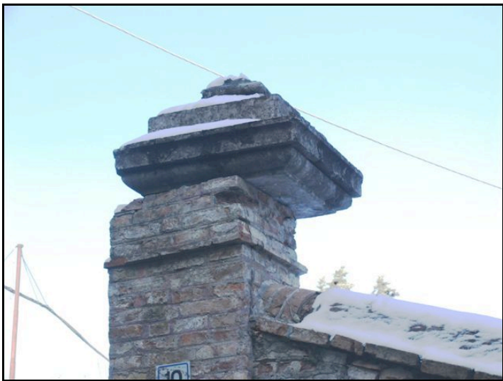
Foto n. 21 – San Vitale di B. (Sala Baganza): slittamento e parziale rotazione del capitello di una colonna in un muro di recinzione