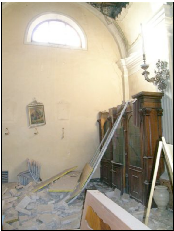
Foto n. 8 - Mamiano (Traversetolo): chiesa inagibile per crollo della volta in una cappella laterale