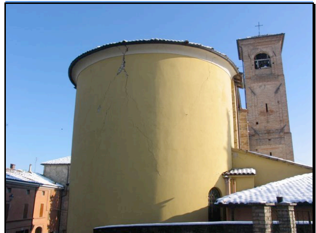
Foto n. 18 - San Vitale di Baganza (Sala B.): lesioni passanti parte sommitale esterna dell'abside