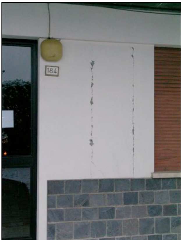
Foto n. 13 – Poggio S. Ilario (Felino): lesione fra pilastro e tamponatura in un edificio in c.a.