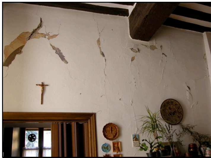
Foto n. 20 – San Vitale di B. (Sala Baganza): edificio privato, lesioni diffuse e distacco di intonaco