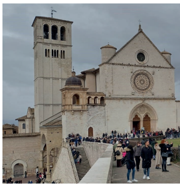
foto (chissà poi perché...); pochi in raccoglimento alla tomba di San Francesco.

Tanti steward intenti per lo più a far defluire la gente e controllare che non facciano